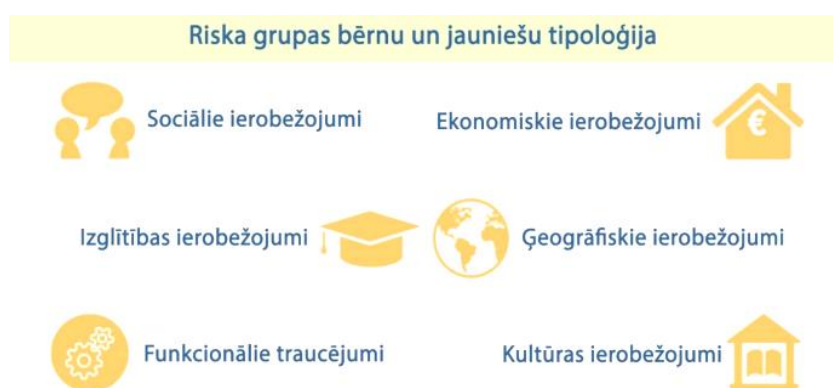
2. att. Riska grupas bērnu un jauniešu tipoloģija (Metodiskais materiāls..., 2019, 27)

ES Padomes Ieteikumā ar ko izveido Eiropas Garantiju bērniem norādīts, ka bērni, kuri ir pakļauti īpaši nelabvēlīgiem apstākļiem, biežāk saskarsies ar šķēršļiem piekļuvē pakalpojumiem, kuri ir būtiski viņu labklājības nodrošināšanai un viņu sociālo, kognitīvo un emocionālo prasmju attīstībai (Padomes ieteikums, ar..., 2021). Riska bērni dzīvē saskaras ar dažāda rakstura grūtībām, kas visbiežāk izpaužas kā sociālie, ekonomiskie, izglītības, ģeogrāfiskie, kultūras un funkcionālie ierobežojumi (skatīt 2. att.) (Metodiskais materiāls – rokasgrāmata..., 2019).